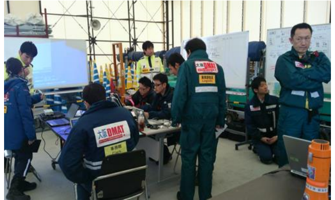
SCU本部ロジ 参集DMATの情報管理、周辺病院の状況、航空機搭乗者リストの作成を行う