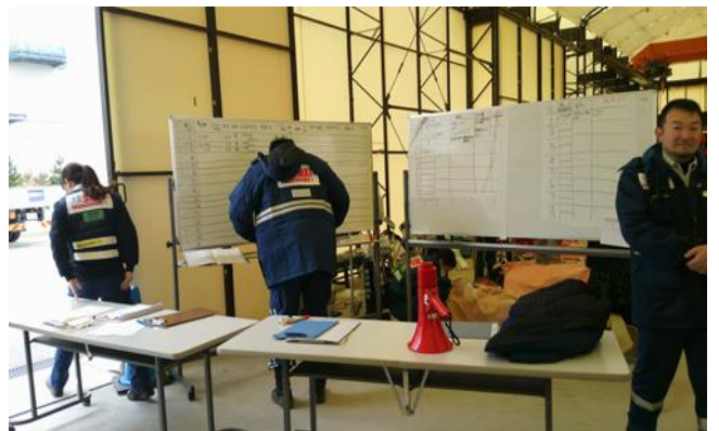
入口搬入管理の様子 患者の情報を収集しリスト化している