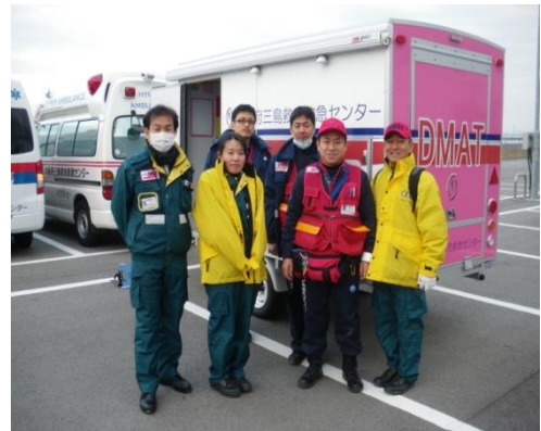
今回は大阪医大との混成チームで出動

大阪府、府内43市町村、大阪府内消防・警察、陸上自衛隊、海上保安庁、国土交通省、日本赤十字社、大阪府立急性期総合医療センター、大阪・滋賀・京都・兵庫DMAT、大阪府医師会、NEXCO西日本など70団体