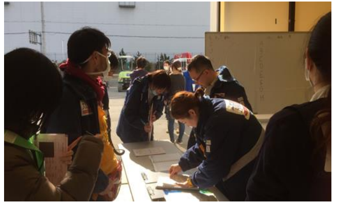
続々とDMATが参集 こちらは入口の搬入管理担当の様子 患者受入体制を整える