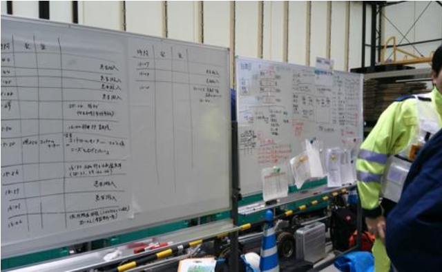
SCU本部ホワイトボード クロノロ（時系列記録）や組織図、参集DMATリストなどを記録