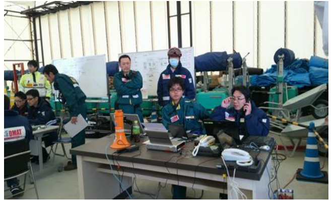
SCU本部の様子 ODCCに衛星電話で連絡し航空機の飛行スケジュールなどを確認