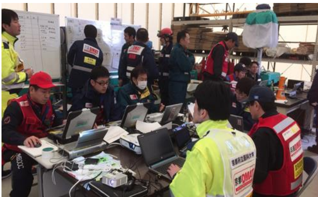
ここで各隊のロジスティクスだけを召集し本部ロジとして情報収集・管理チーム結成