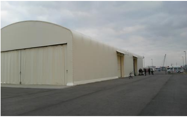
ODCCより活動指令あり 堺SCU（近畿圏臨海防災センター）へ移動