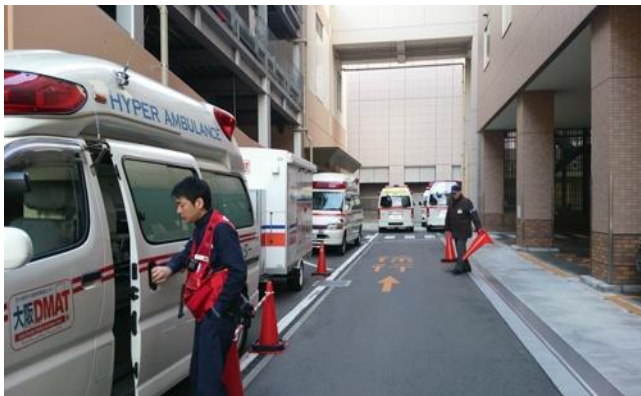
ODCC（大阪府災害コントロールセンター）からの指示により参集拠点の多根総合病院へ