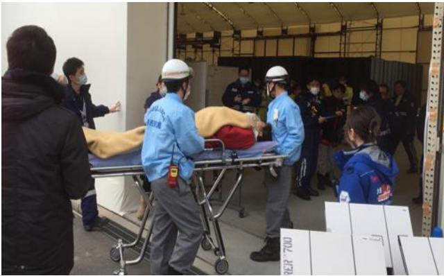
患者搬入 患者はここを拠点として被災地の外に広域搬送される