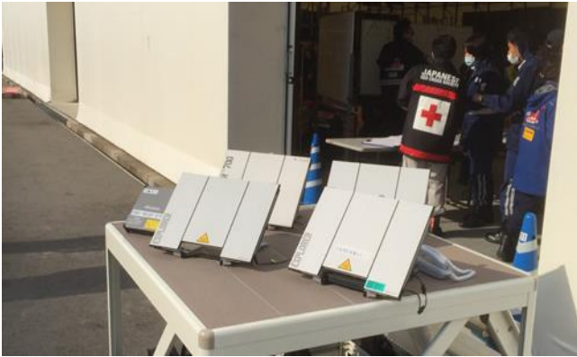
三島・大阪医大チームは搬出エリアを担当することに まずは衛星電話設置