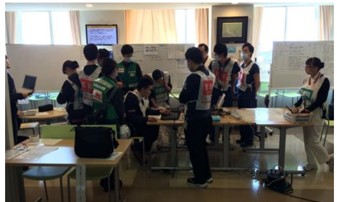
多根総合病院の参集拠点本部 参集した各DMAT隊はODCCから指示があるまで待機