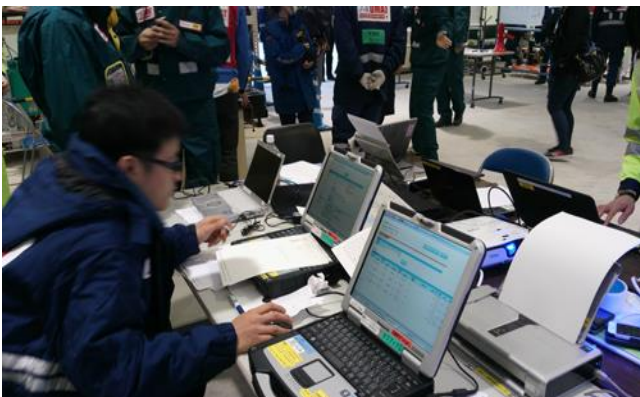
EMISを使用して航空機搭乗者リストを作成中 三機目の搭乗者リストを作成したところで 訓練終了