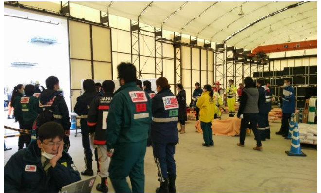
診療ゾーン ここでは航空機搬送に向けて安定化処置を行う