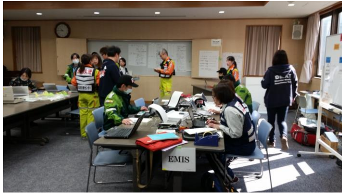
姫路医療センター内のDMAT活動拠点本部の様子 三島DMATは診療部門の活動指示を受ける