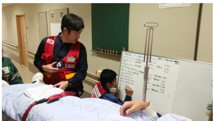
搬出エリアの様子 岸田Nsが担当。誰が、いつ、何処へ、どの様な 方法で搬出されたか、確実な患者管理を実施！