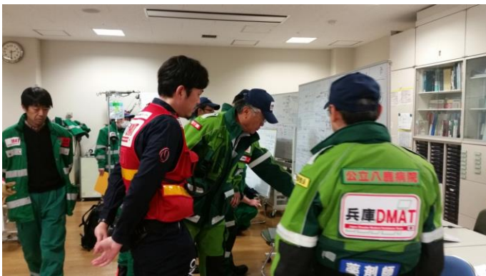
患者リストを見ながら搬送順位を決定 院内入院か？SCUか？近隣の二次病院か？ バイタルサインや病態を考慮しながら搬送順位を 決定！