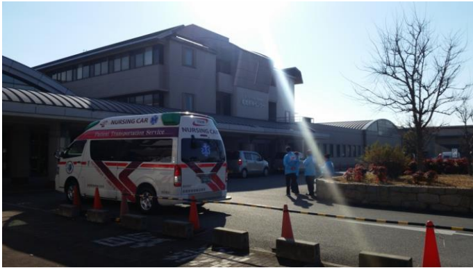
姫路医療センター到着 活動拠点本部に到着連絡、受付後院内で待機指示